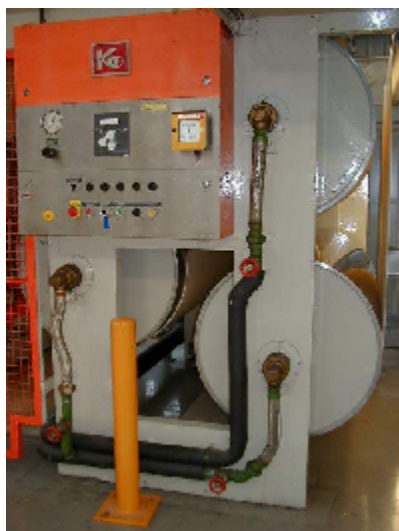
Kühleinheit mit 3 Kühlwalzen der Druckmaschine 4

Die in diesem Projekt ermittelten Kälteleistungen und Jahreskosten dienen als Grundlage für die Ausschreibung der Kälteversorgung bei der Firma Hornschuch.